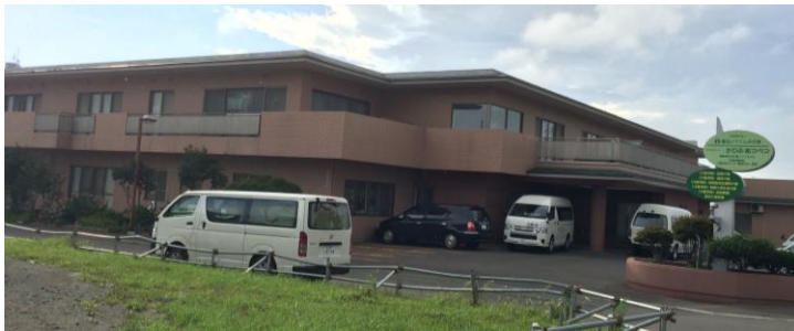
かりふ・あつべつ

浦安に84人定員の特養が来春開設間近となり、同じ規模の施設を見学させていただいています。 8月11日、「その人らしい生活づくり」をケアの基本としており「食べること」も大切にされているという評判を聞き、札幌市厚別区にある特別養護老人ホームかりふ・あつべつを訪問させていただきました。 終の住処として入居される方も多いなか「豊かな生活