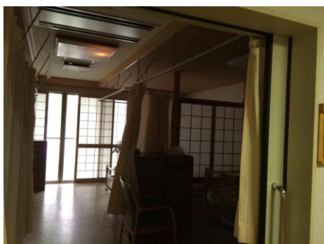
多床室は障子とカーテンで区切られています

浦安に84人定員の特養が来春開設間近となり、同じ規模の施設を見学させていただいています。 8月11日、「その人らしい生活づくり」をケアの基本としており「食べること」も大切にされているという評判を聞き、札幌市厚別区にある特別養護老人ホームかりふ・あつべつを訪問させていただきました。 終の住処として入居される方も多いなか「豊かな生活