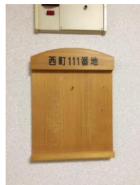
表札をかける木のボード

を送れるよう支援します」というスローガンをかかっています。 特養の入居者さんは80名です。 みなさんの表情が明るく豊かで思わず話かけてしまいました。 ケアワーカー43名のほとんどが介護福祉士、そのうち常勤39名、5交代の体制を組んでおり、人員体制の大切さを感じました。