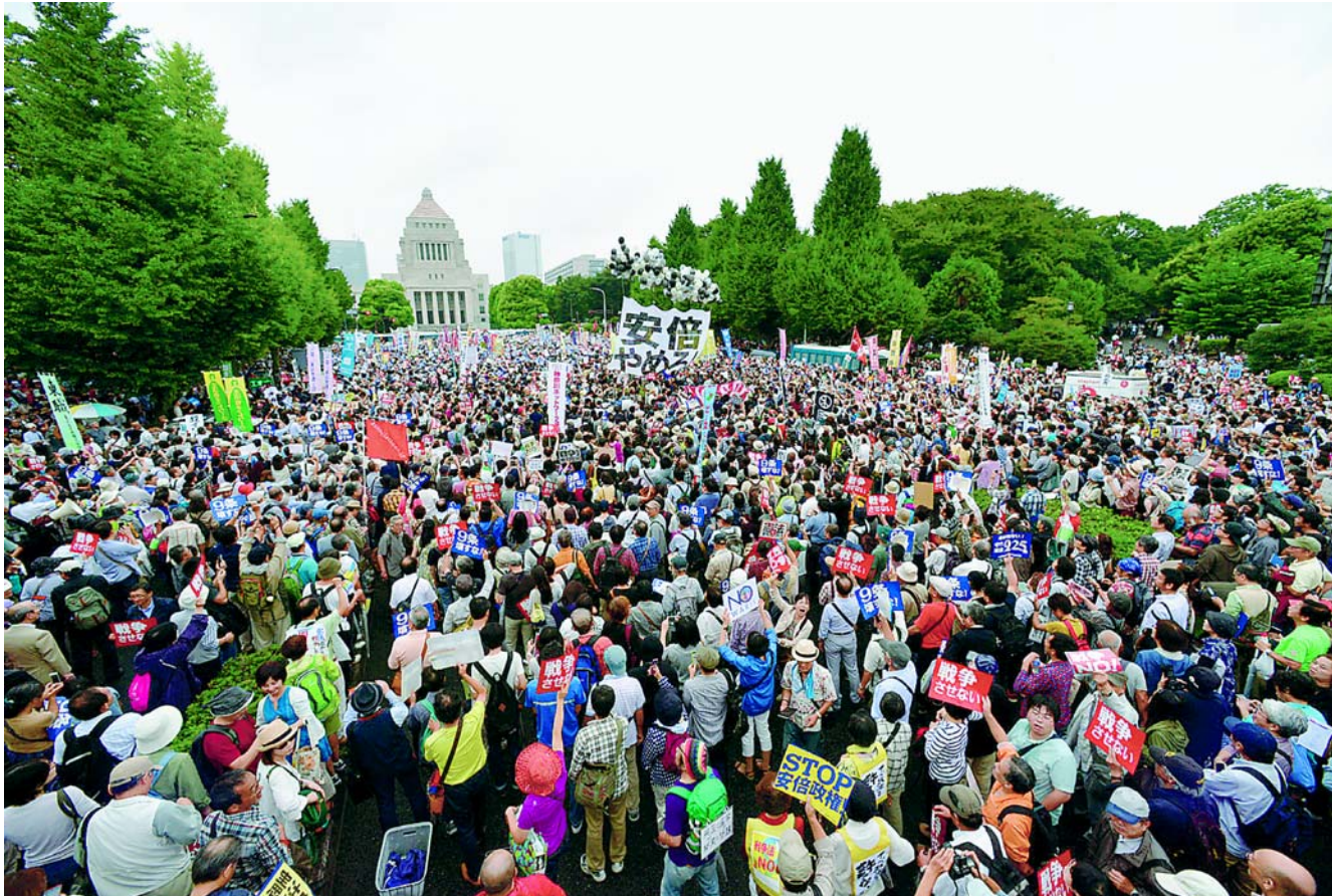
国会を取り囲み、戦争法案廃案、安倍首相退陣を求めてコールする人たち=30日、国会正門前