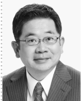
こいけ あきら 晃

1960年東京世田谷区生まれ、52歳 東北大学医学部卒 日本共産党 副委員長 党政策委員長 前参議院議員 医師