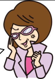
日本共産党 カクサン部!